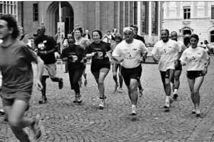
Start zum Sponsorenlauf