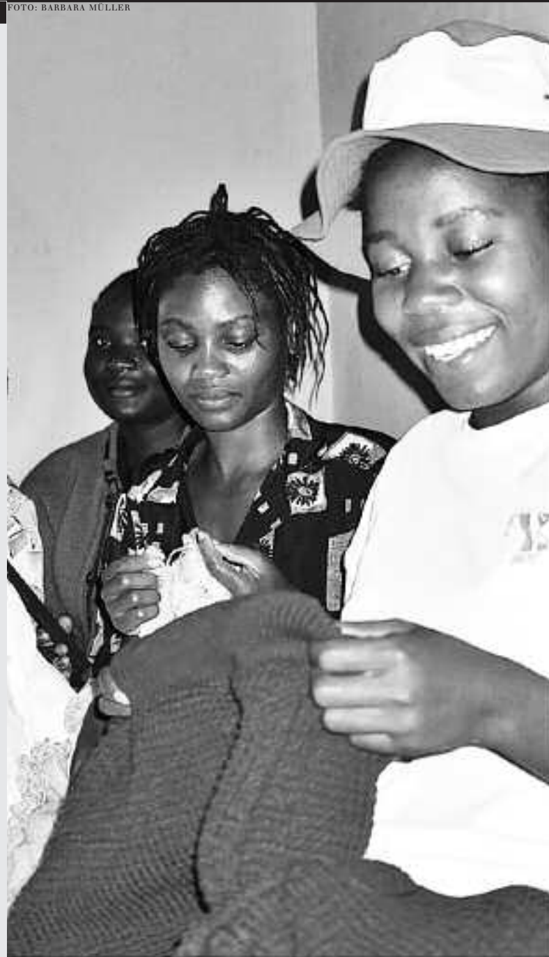
KUIYSAP: Ausbildung an Strickmaschinen – eine Hoffnung für junge Township-Bewohnerinnen