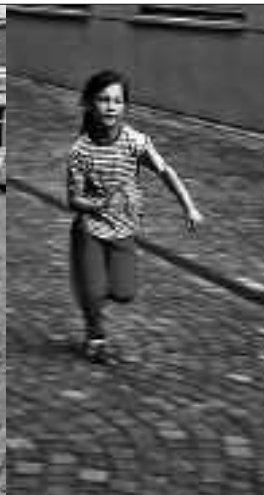
Grosser Einsatz der jüngsten Läuferin