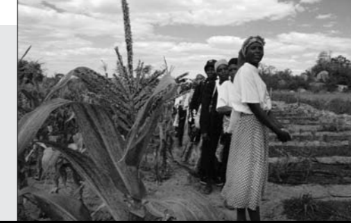
Ein Heilkräutergarten von Batanai

Batanai HIV&Aids Support Group Messbare Erfolge