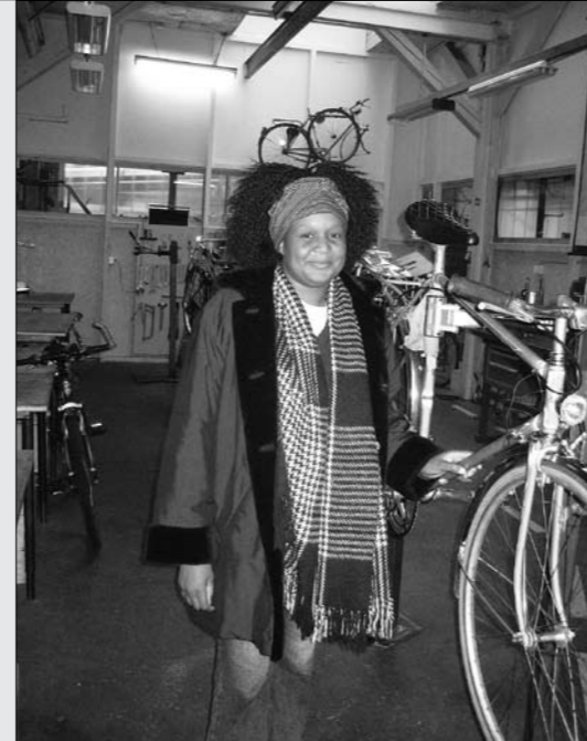
Youth Ahead Zimbabwe Velos aus der Schweiz für ein neues Standbein