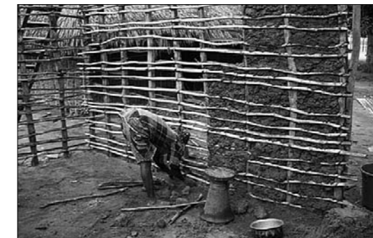
Kampf gegen die Malaria Die Moskitonetze werden geschätzt

Bau des vom fepa finanzierten Geburtshauses