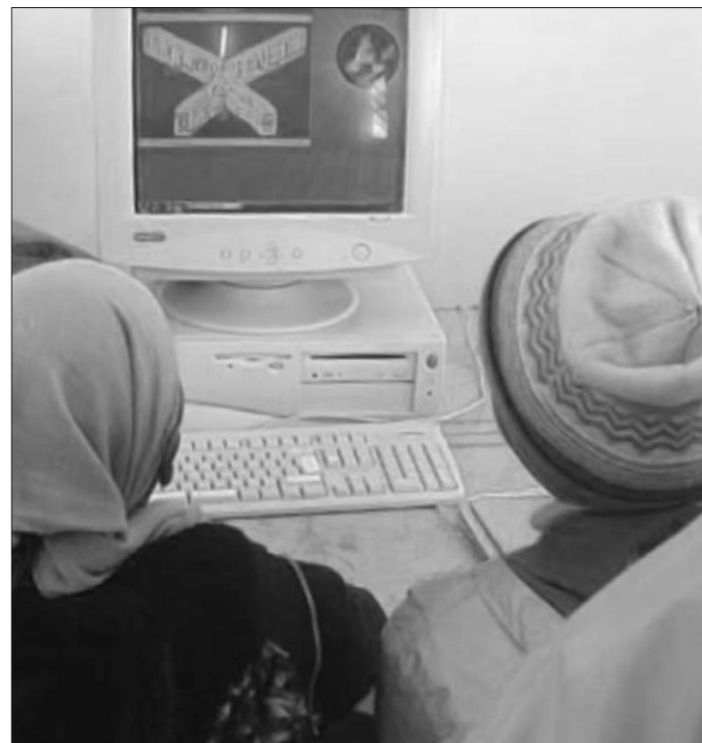
Computerunterricht in Idutywa, Eastern Cape.