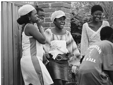
Die Dangwe Arts Family beim Spiel

jekte auf die Beine stellen können. Aber auch Lebenskunde wird gelehrt, dazu gehören die Aufklärung über die Risiken von HIV/Aids und wie Mann und Frau sich vor einer Ansteckung schützen können, die Aufklärung junger Frauen über ihre Rechte und wie sie sich dafür wehren können, die Aufklärung über die Rechte von Jugendlichen. Der fepa unterstützt dieses Jugendprogramm mit einem Beitrag von 10000 Franken.