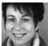
Liebe Frau X Lieber Herr Y

Die Belastung der ZimbabwerInnen ist enorm. Zu den wirtschaftlichen Schwierigkeiten und der politisch aussichtslosen Lage gesellt sich die stille Katastrophe HIV/Aids. Noch immer ist