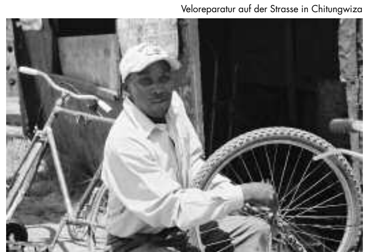
Veloreparatur auf der Strasse in Chitungwiza